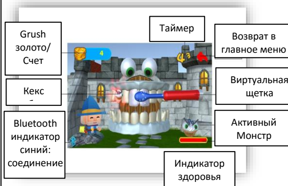
Рис. 3 Главное меню Toothy Castles