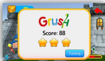
Рис 5. Оценка сеанса чистки щеткой с помощью кнопки отслеживания (Tracking)

14. Grush имеет функцию отслеживания для родителей для проверки результатов чистки зубов. Когда игра завершена, вы можете выбрать функцию отслеживания или доступ к экрану отслеживания для предыдущей сессии прямо из главного меню.