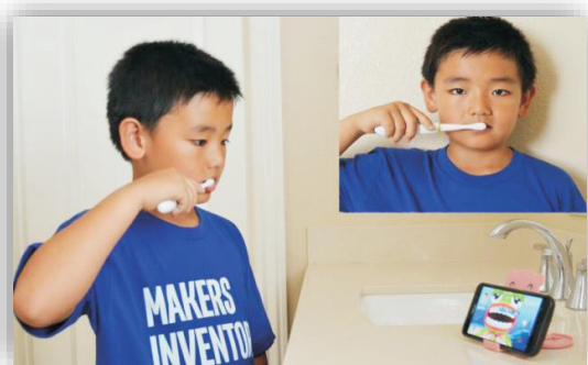
Рис. 1 Запуск игры Grush и стартовая позиция