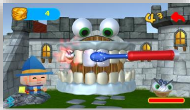
Рис 4 Основной экран игры

14. Grush имеет функцию отслеживания для родителей для проверки результатов чистки зубов. Когда игра завершена, вы можете выбрать функцию отслеживания или доступ к экрану отслеживания для предыдущей сессии прямо из главного меню.